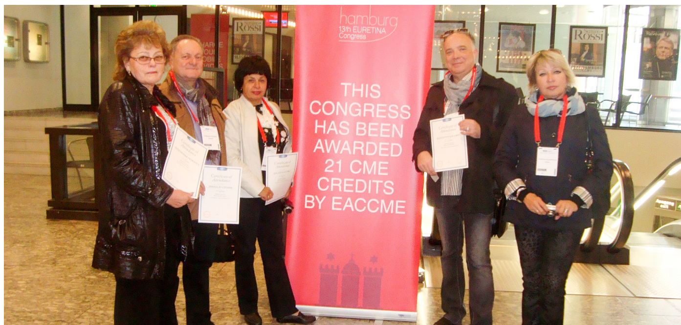
Группа сотрудников кафедры на конференции «Евроретина 2013» (Гамбург).