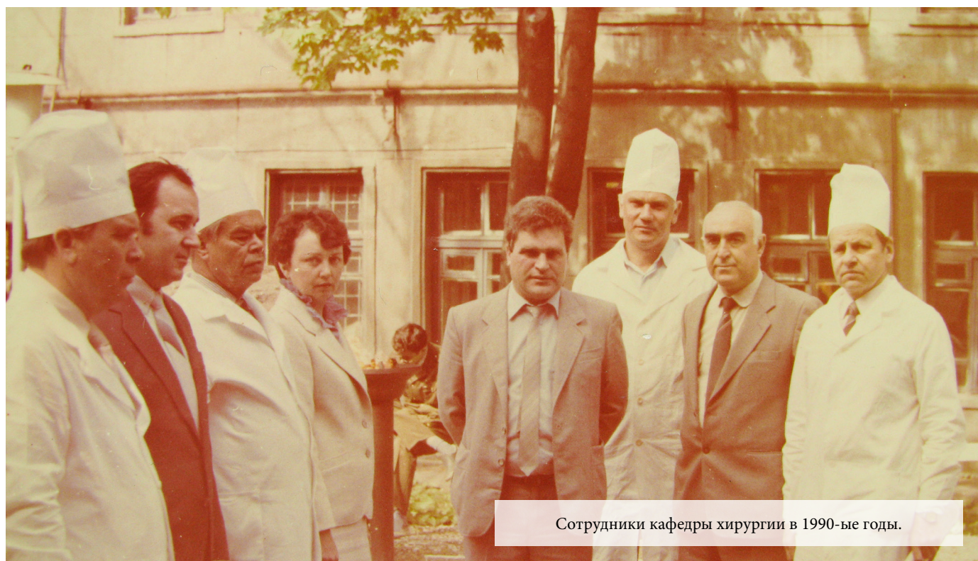
Сотрудники кафедры хирургии в 1990-ые годы.