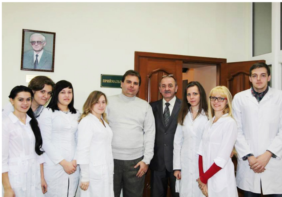
Первый состав студенческой редколлегии