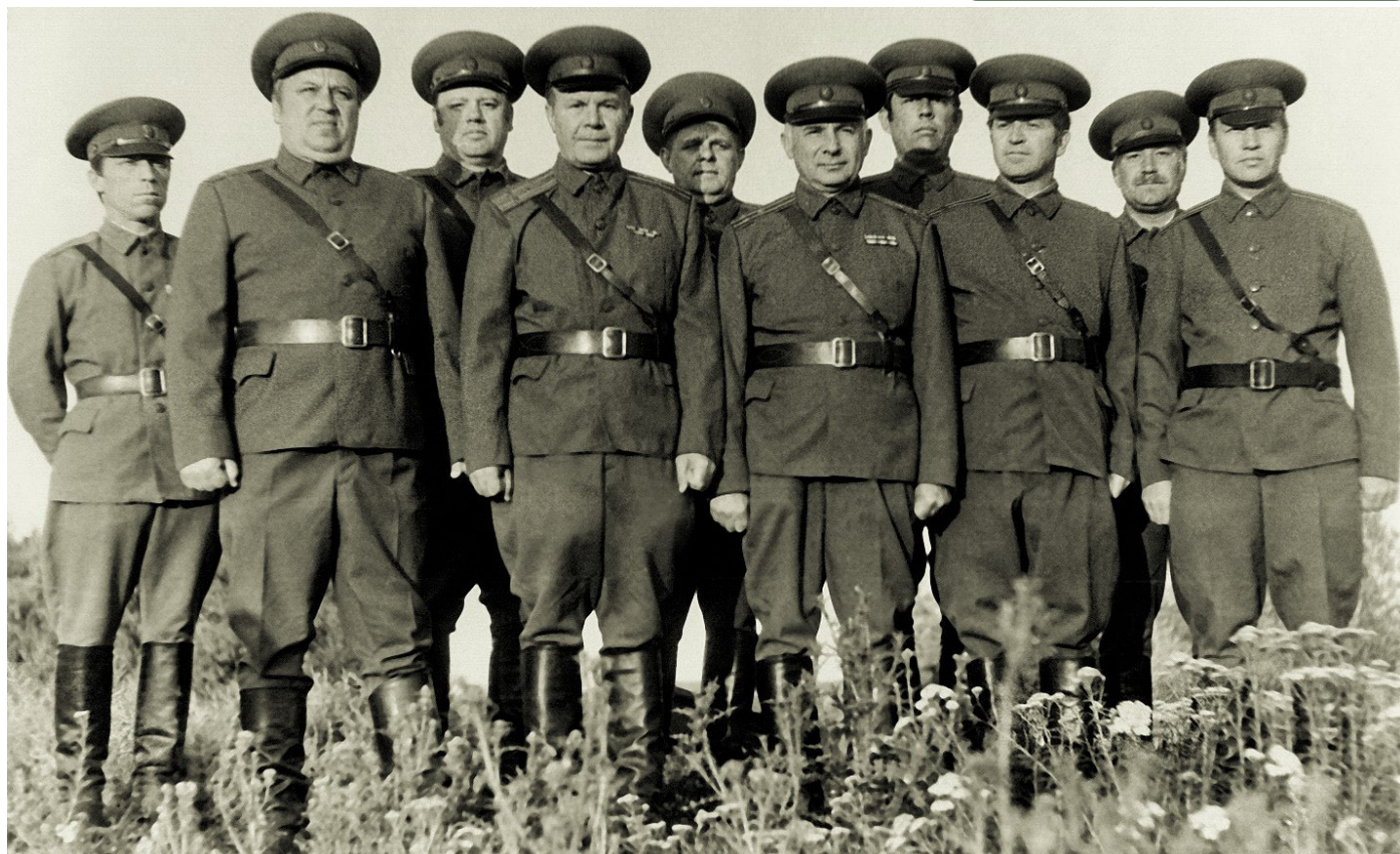
Коллектив кафедры в 50-е годы XX века

– Любая кафедра вуза выполняет учебную, научную и методическую