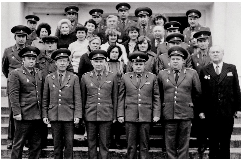
Состав кафедры в 70-е годы XX века

Военная подготовка студентов органически вплетена в процесс формирования будущего специалиста, получающего наряду с другими медицинскими знаниями, подготовку в области военной медицины. Задачей вуза является не просто выпуск высококвалифицированных медицинских специалистов, но и подготовка офицеров медицинской службы запаса, беззаветно преданных своей стране, морально устойчивых, дисциплинированных, способных выполнять обязанности по медицинскому обеспечению войск в сложных условиях боевой обстановки. Таким образом, новые, отвечающие современным требованиям стандарты подготовки нацелены на то, чтобы будущий врач – офицер медицинской службы запаса был всесторонне компетентен в вопросах организации и тактики действий по оказанию всех видов медицинской помощи в условиях чрезвычайных ситуаций мирного и военного времени.