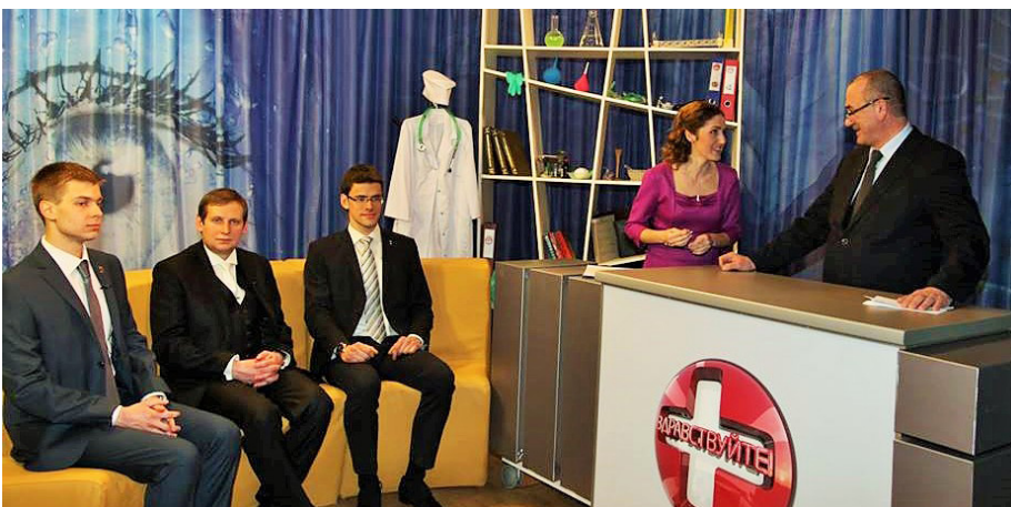
Эфир на телеканале «Донбасс»