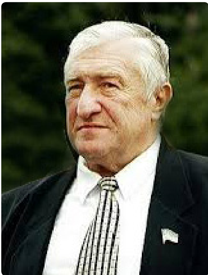
Профессор В. К. Гусак

боратория, создана клиническая иммунологическая лаборатория. Первым в Донбассе он освоил и внедрил реплантации конечностей, операции на открытом сердце и проводящей системе сердца.