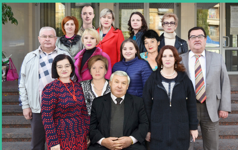
Коллектив кафедры 2015 год