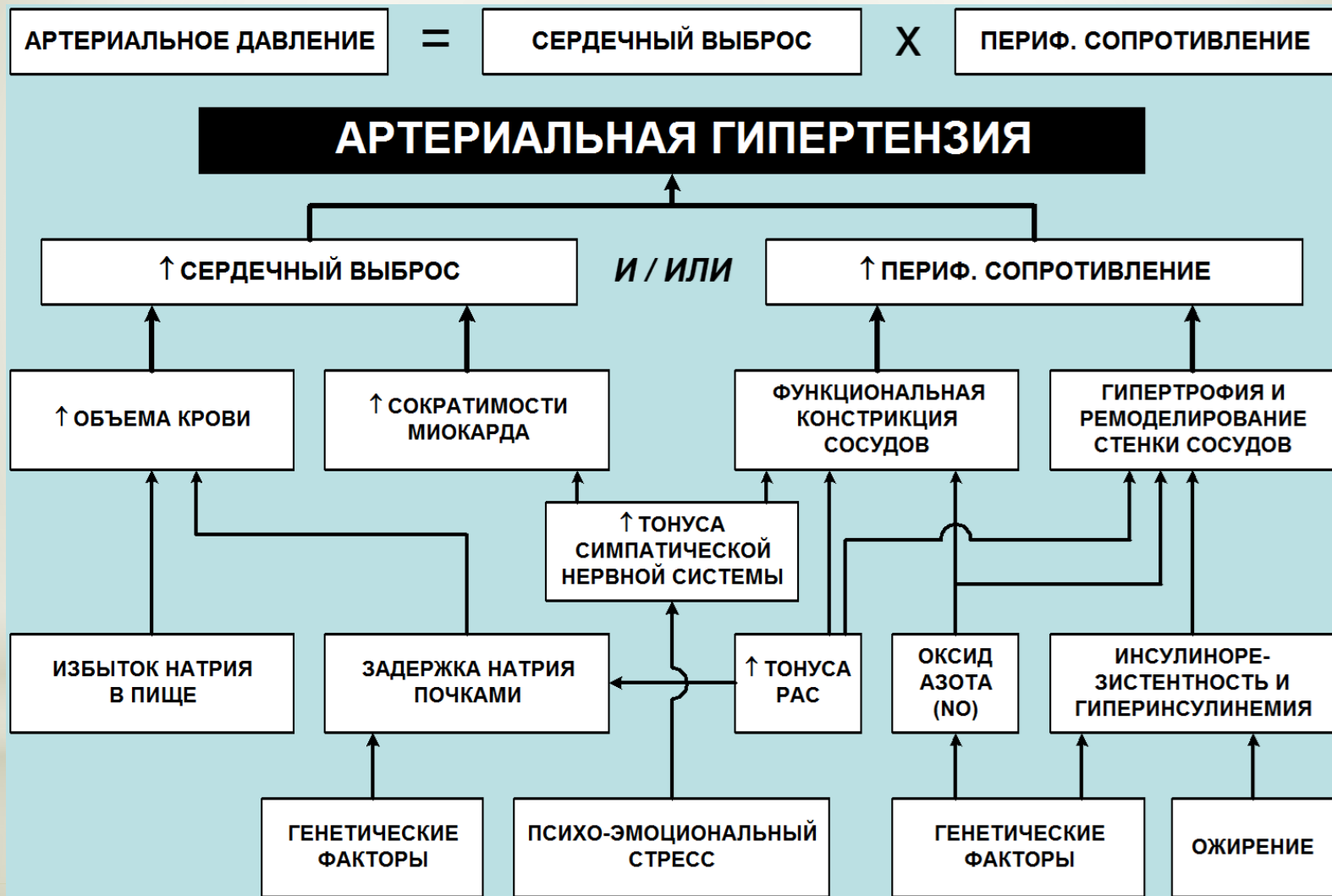
Рис.1 Патогенез гипертонической болезни