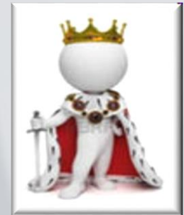
Тренинг позитивного самовосприятия