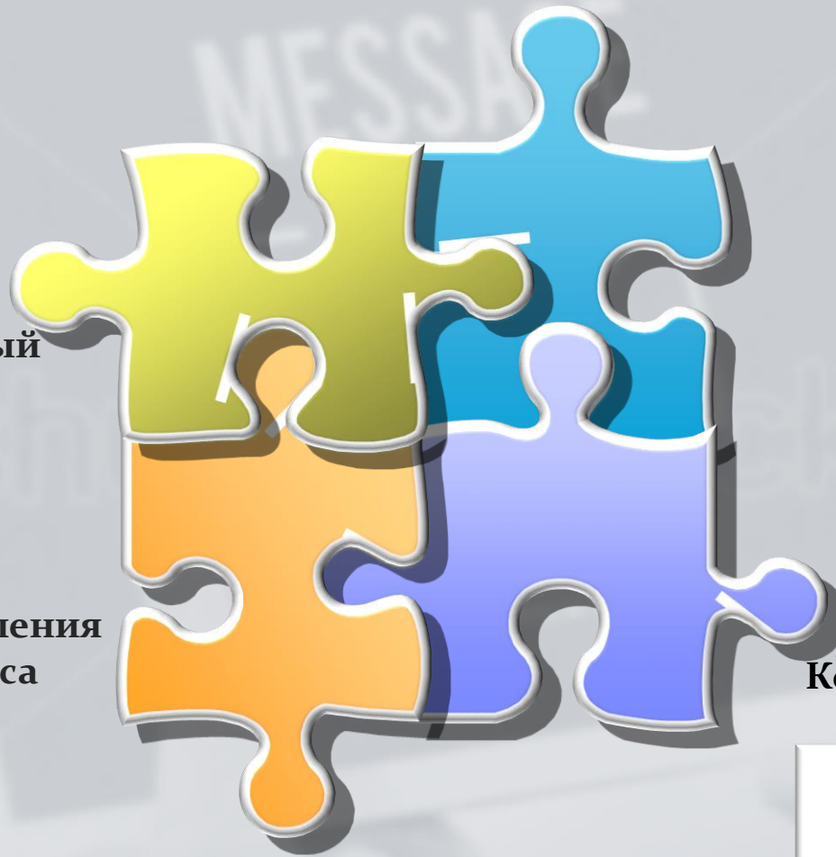
Тренинг улучшения комплаенса