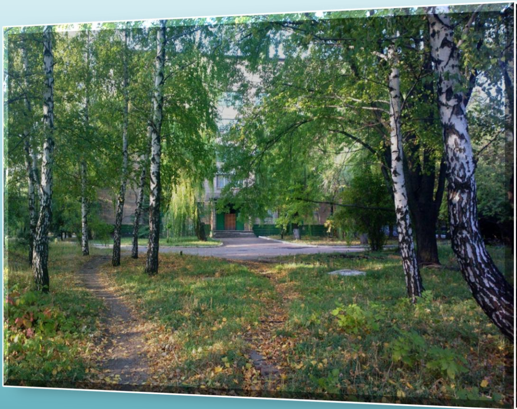
Парковая зона больницы, лечебный корпус №2

Дорогие выпускники! Пациенты вас ждут в стенах нашего учреждения и рассчитывают на бескорыстное и полное применение всех знаний, а мы -на искреннее стремление к профессиональному развитию во благо здоровья людей.