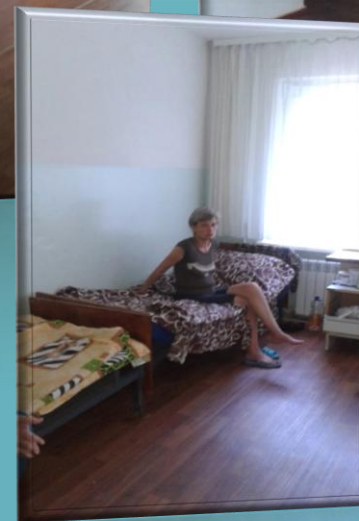
Фото пациентов предоставлены с информированного добровольного согласия пациентов согласно статье № 8 Закона Донецкой Народной республики "О психиатрической помощи". -