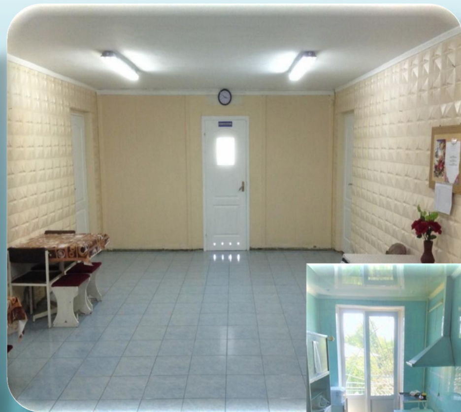
Общепсихиатрическое отделение №6